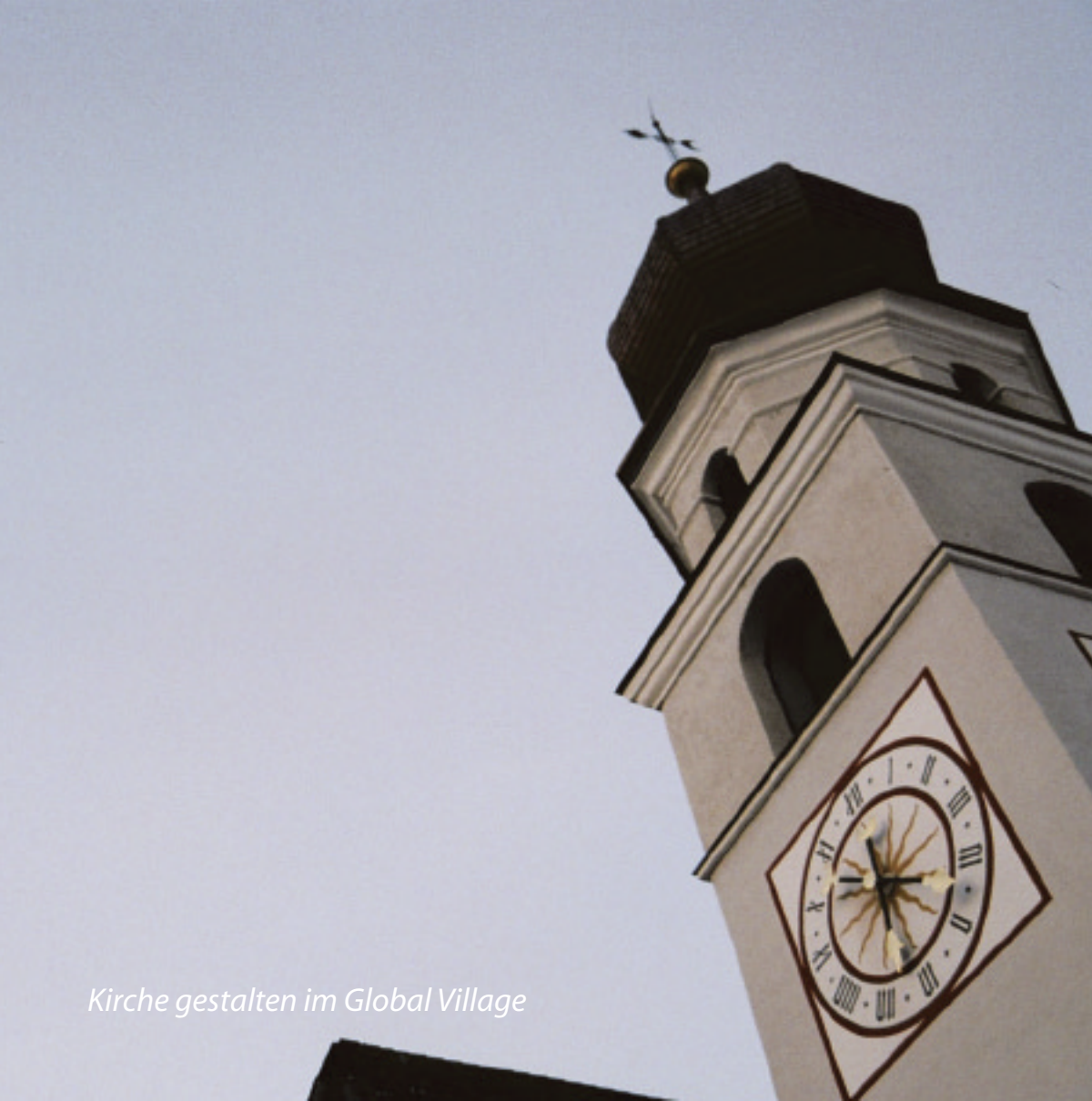
Kirche gestalten im Global Village