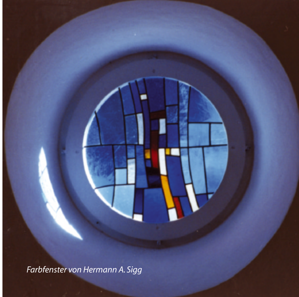
Farbfenster von Hermann A. Sigg